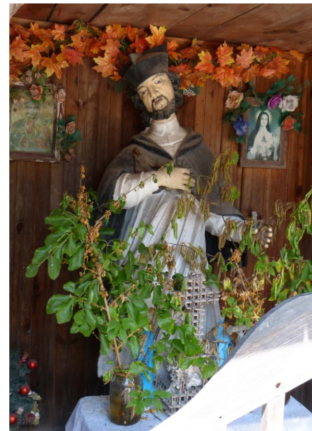
Drewniana figura Jana Nepomucena w drewnianej kapliczce przy głównej drodze przez wieś Porąbki