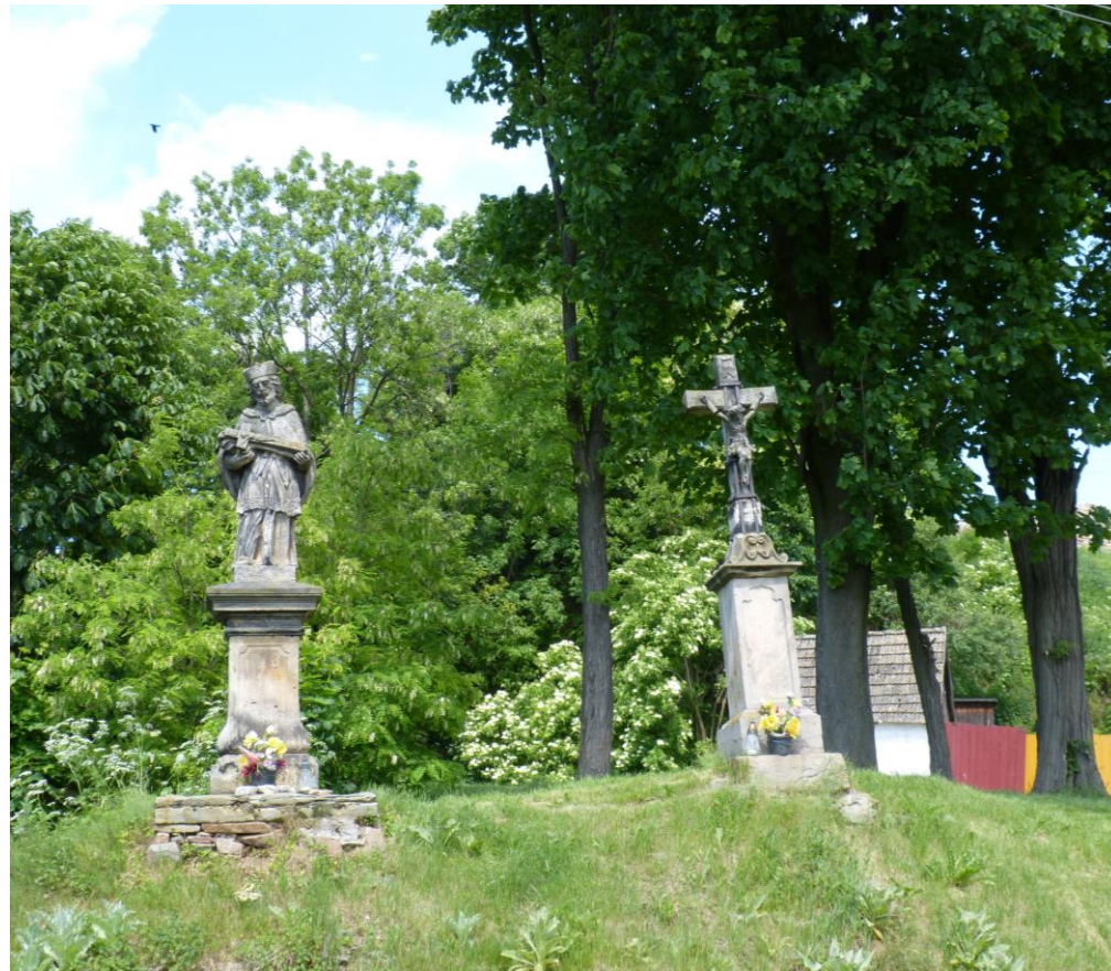
Jan Nepomucen na pagórku nad rzeczką Psarką