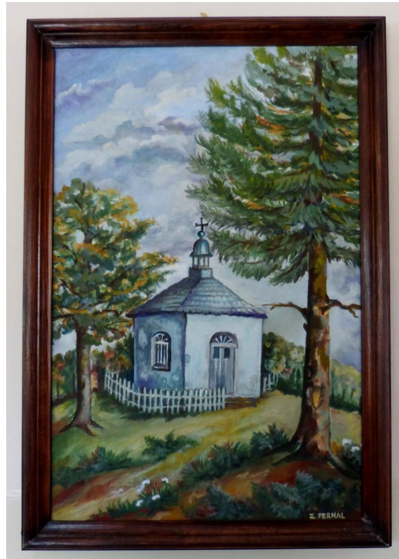
Kapliczka Jana Nepomucena w Samsonowie-Ciągłym mal. Z. Pernal