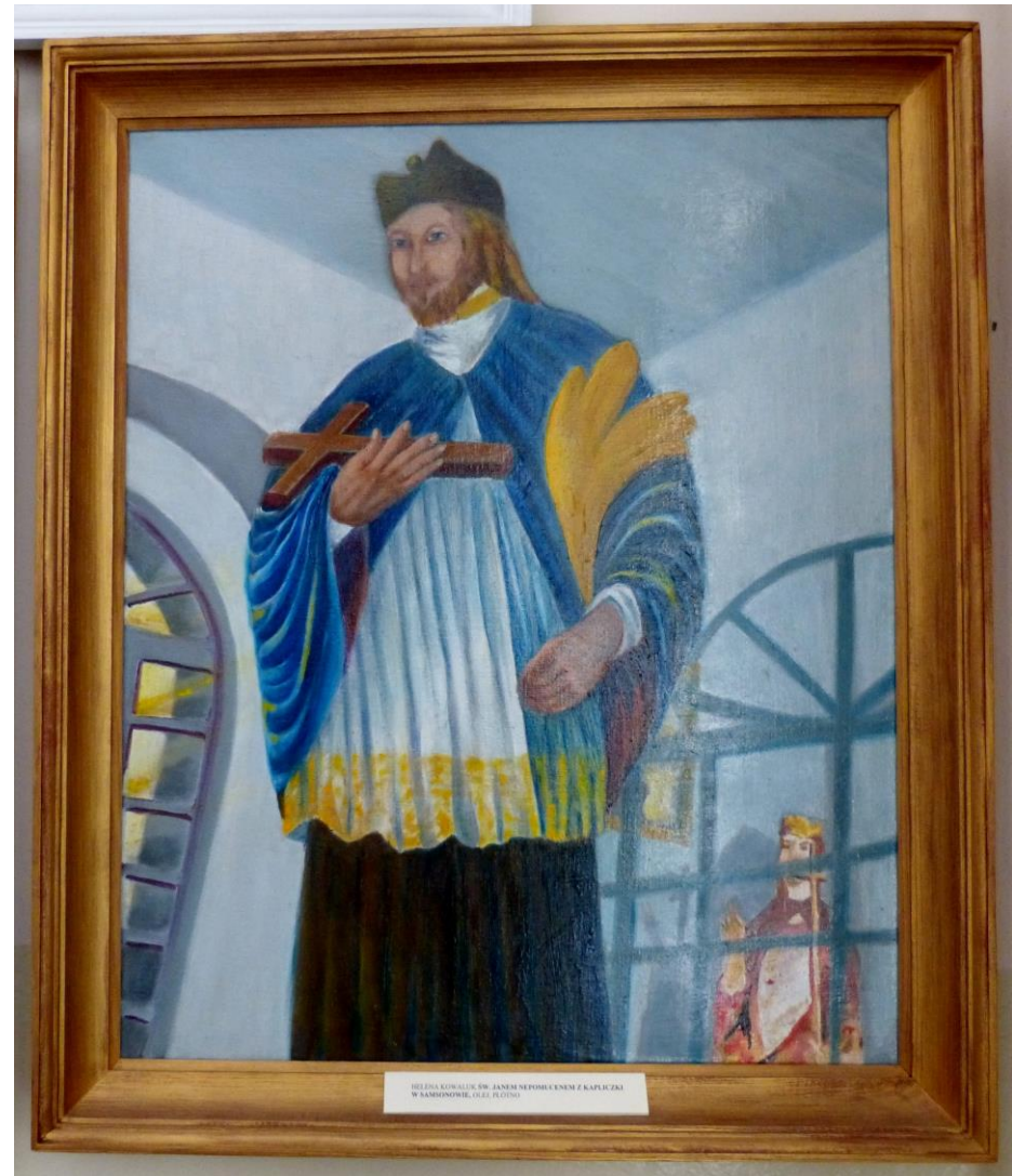
Jan Nepomucen z kapliczki w Samsonowie-Ciągłym mal. Helena Kowaluk