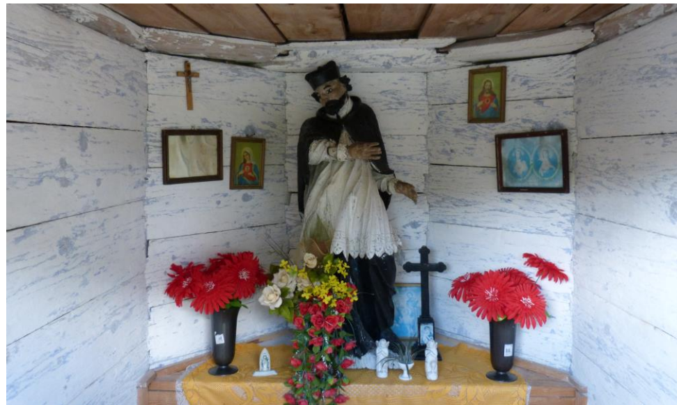
Drewniana kapliczka przy drodze na Święty Krzyż z drewnianym Janem Nepomucenem