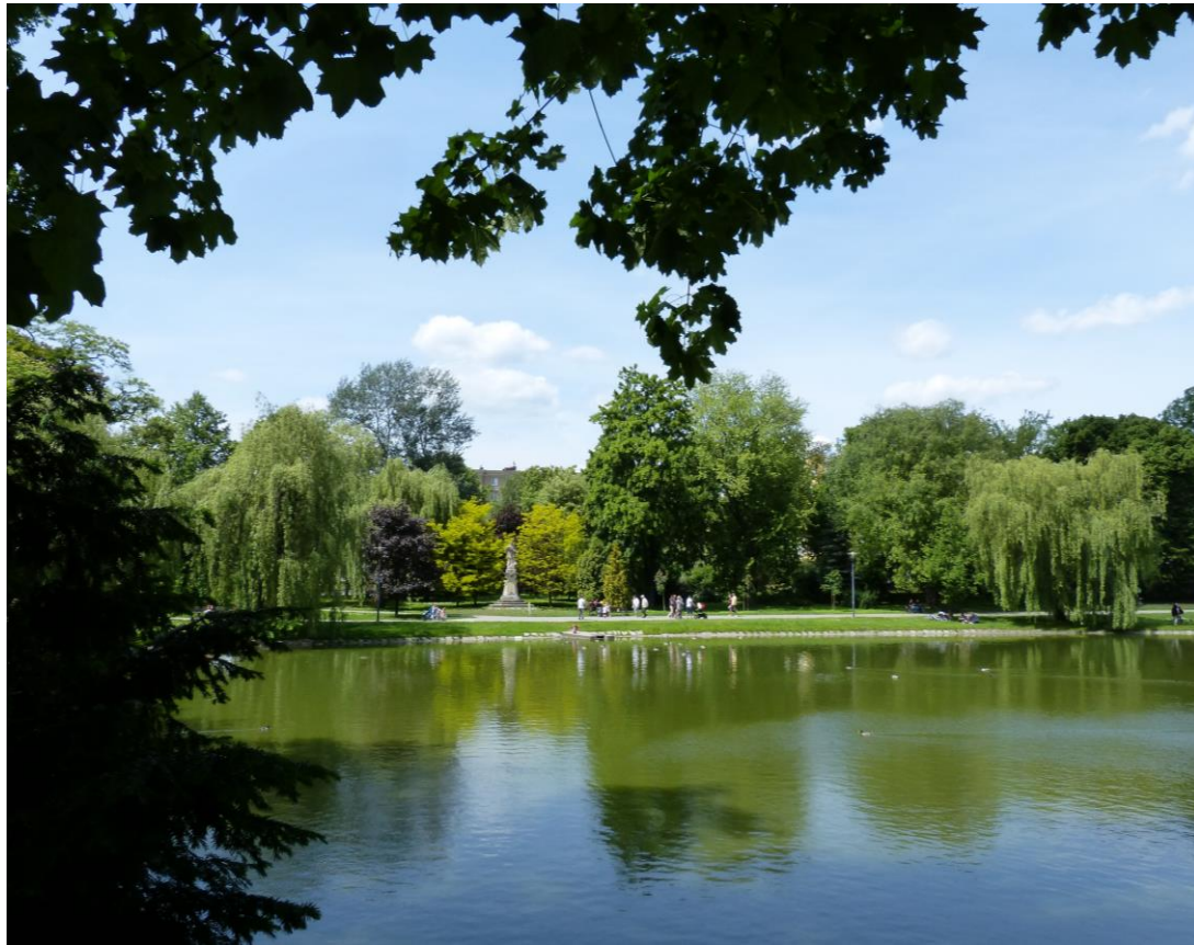
XVIII-wieczny rokokowy Jan Nepomucen w parku nad stawem