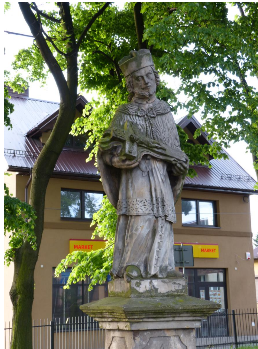
Jan Nepomucen z 1807 na skwerku przy Dolnym Rynku