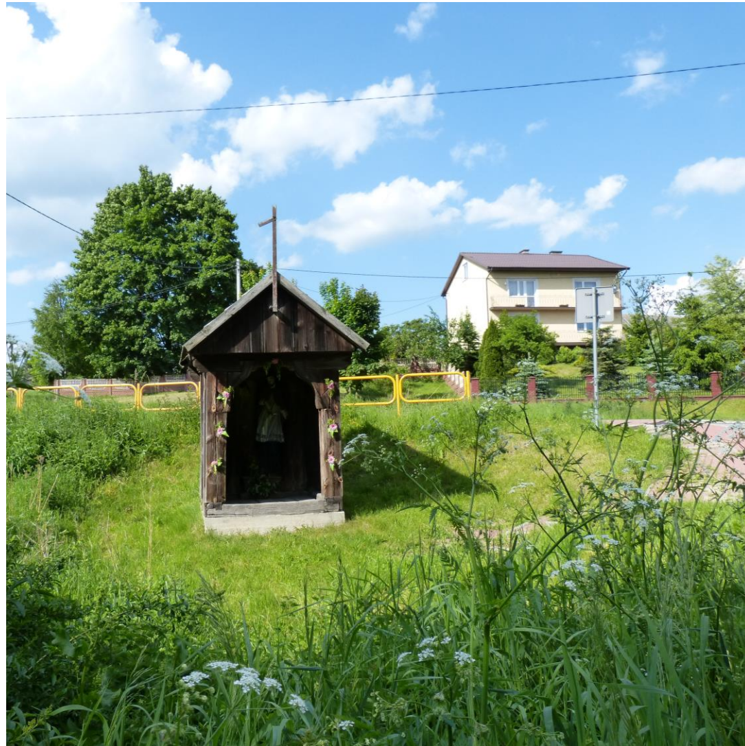
Drewniana kapliczka przy strudze, ok. 25 km na wschód od Kielc, przy drodze krajowej 74. W kapliczce drewniana figura Jana Nepomucena.