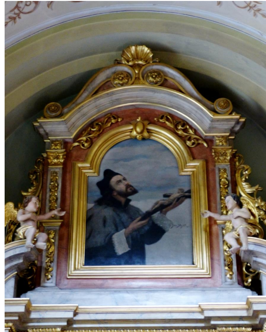
Barokowy kościół św. Wojciecha z 1763; Jan Nepomucen w zwieńczeniu ołtarza św. Józefa, zamykającego lewą nawę. Autorem obrazu jest Jan Styka, który mieszkając w Kielcach w latach 1888-90 namalował tu kilka obrazów religijnych (również Józef z Jezusem w tymże ołtarzu jest jego pędzla) – wszystkie sześć można znaleźć i obejrzeć w tym kościele.