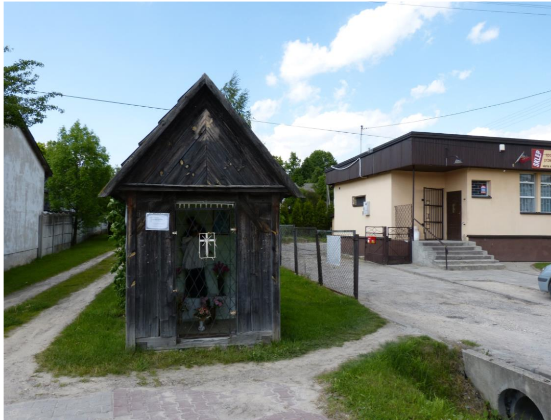
Drewniany Jan Nepomucen w drewnianej kapliczce przy skrzyżowaniu drogi wojewódzkiej 753 (Wola Jachowa – Nowa Słupia) z lokalną drogą do Huty Starej i dalej na Święty Krzyż.