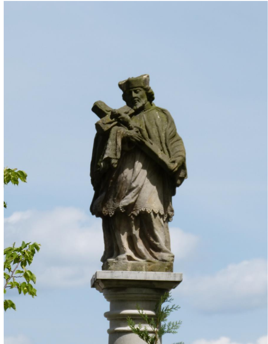
XVIII-wieczna figura Jana Nepomucena na wysokiej kolumnie, na terenie przykatedralnym