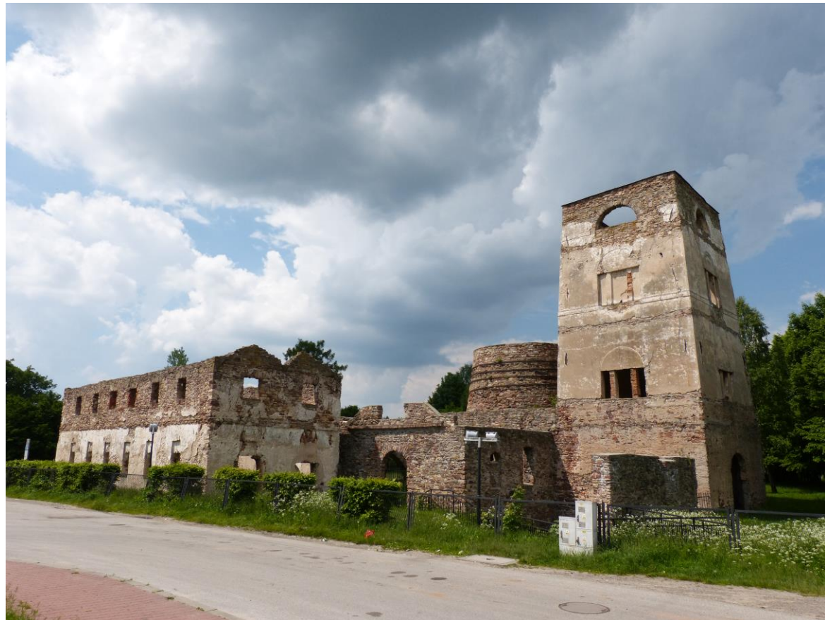
Ładnie zachowane ruiny XIX-wiecznej huty żelaza w Samsonowie