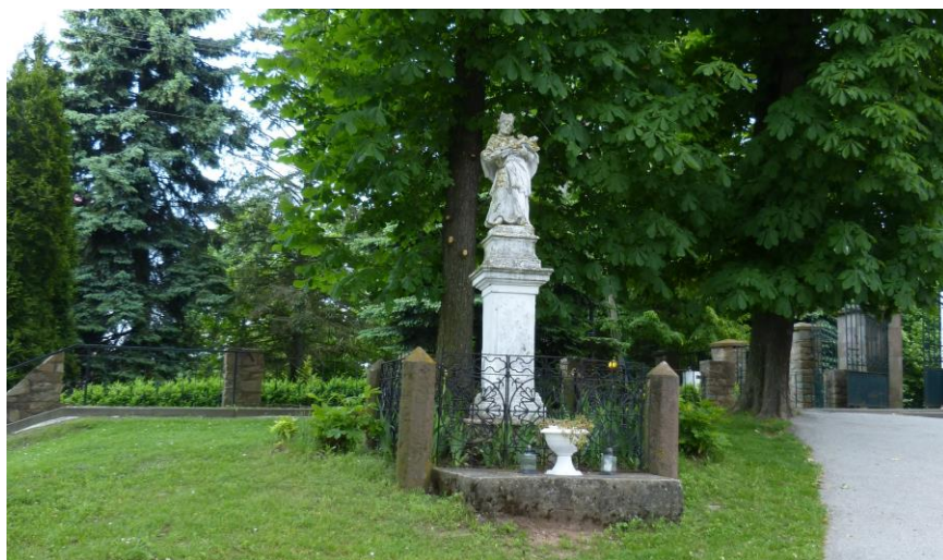
Kamienny Jan Nepomucen z roku 1774 przed barokowym kościołem św. Rozalii z lat 1668-76