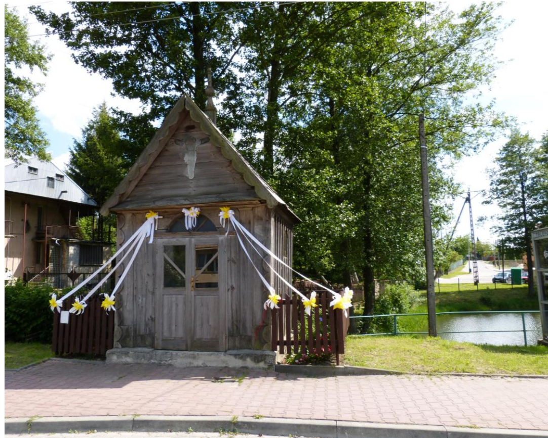
Drewniana figura Jana Nepomucena w drewnianej kapliczce przy stawie. Ręce bez tradycyjnych atrybutów; ktoś wręczył świętemu bukietik róż.